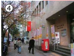
麹町（こうじまち）郵便局