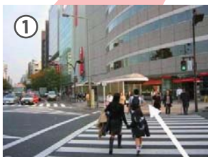
JR「市ヶ谷駅」改札をします