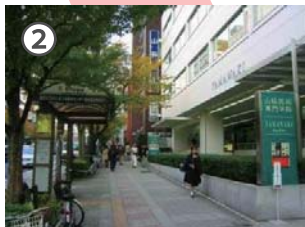
山脇ビル（山脇美術専門学院）を右手にしばらく直進