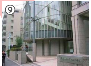
大妻女子大学正門に到着！