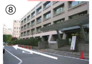
校舎壁面に沿って進み、交差点を右折してください