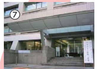
大妻女子大学3階北口に到着！ 正門に向かう場合は左折してください