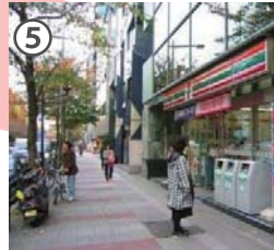
セブンイレブン九段南3丁目店