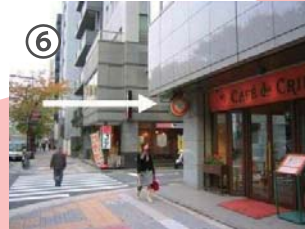
CAFE de CRIE（カフェ・ド・クリエ）の角を右折します