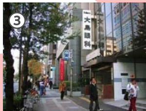
大島眼科 / 地下鉄「市ヶ谷駅」(A3出口)