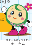
スクールキャラクターおーたん