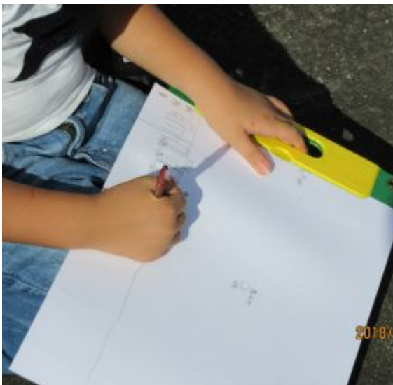
図3 月の位置をシルエット法で記録していく

その結果として、子どもは、月の一日の動きは、太陽と同じようであることをとらえることができた。