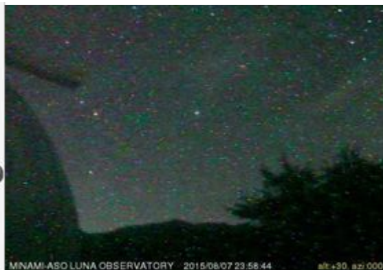
図1 i-CAN 星座カメラの設置箇所