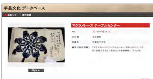
図2 手芸文化データベース 作品詳細ページ