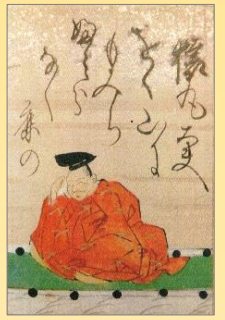
かるた『百人一首』の猿丸大夫 (大妻女子大学図書館所蔵)

物見遊山は、春の桜狩り、秋の紅葉狩りで、テレビの気象情報も、桜前線、紅葉前線を日々実況で伝えている。今年は台風の塩害でもみぢにも影響が出ている。実景は心配だが、本を読む想像の世界でのしむことも出来る。